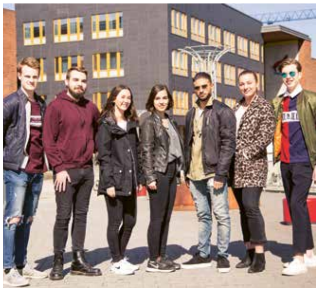
Delar av det nya JSU Studio-teamet