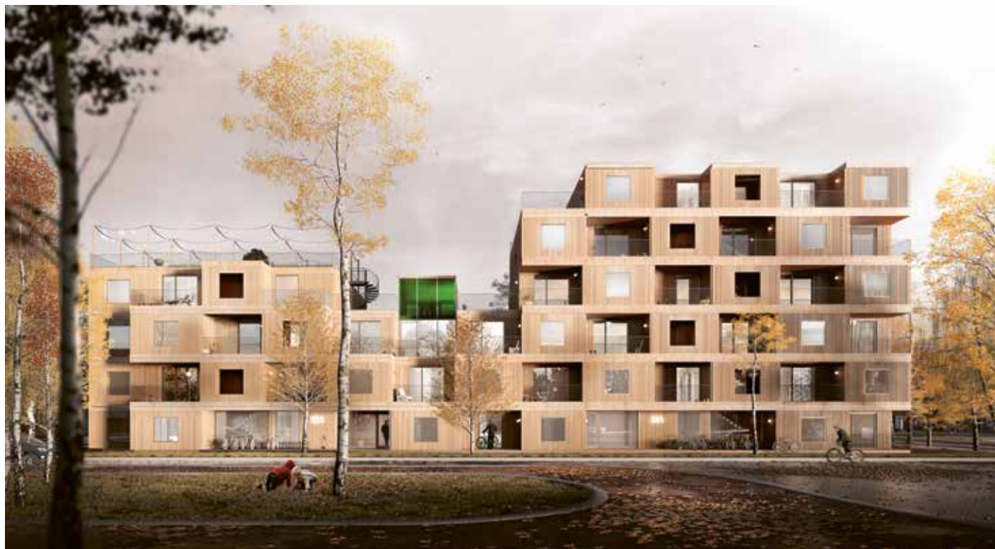
Intresset för att bygga med trä växer bland privata och offentliga fastighetsutvecklare.