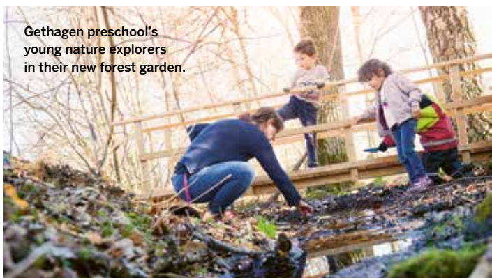
Gethagen preschool's young nature explorers in their new forest garden.

Me & JU is a magazine from Jönköping University. It is distributed in Sweden, but of course we have international friends within the country as well. Here is a short news summary in English for our international staff and partners.