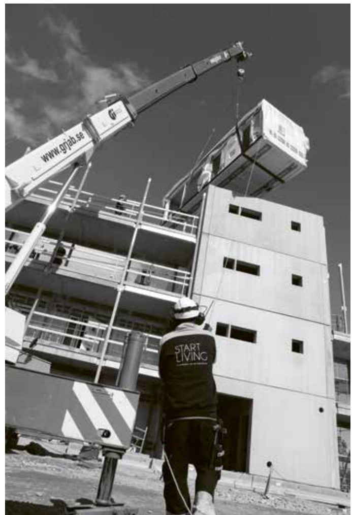
Ökade krav på kundanpassning gör att hustillverkarna måste hitta en ny flexibilitet i produktionen.