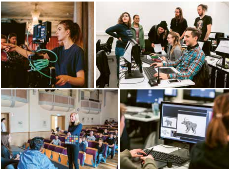
Studenterna vid Visuella effekter har egna inspirerande lokaler på Campus i12.