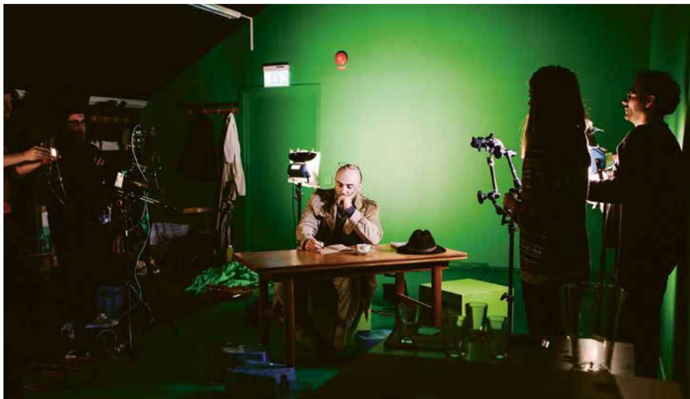
I greenscreen-rummet kan studenterna filma för att sedan lägga till egna specialeffekter.