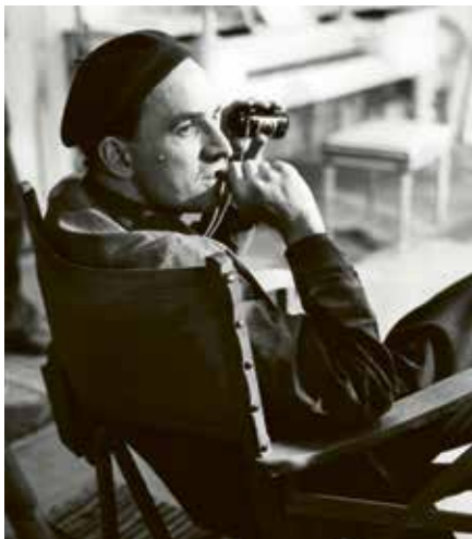
Bergman photo: (C) AB Svensk Filmindustri

TEXT: KATIE BINGHAM | FURNITURE PHOTOGRAPHS: BRIAN PREDSTRUP